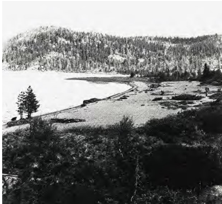
Steinalderlokalitet på Storesanden ved Viksvatn.

Når kulturminneplanen er ferdig må tiltak implementerast i Sti –og løypeplanen.