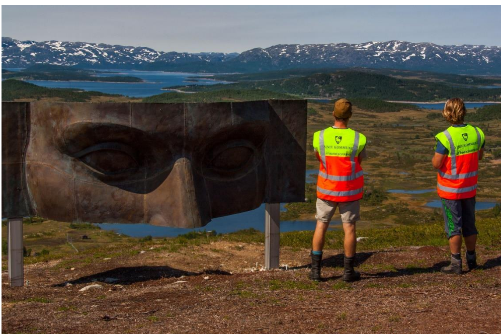
Oppsyn med vidsyn