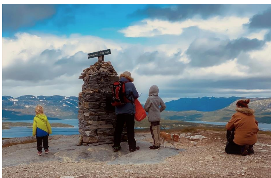
Falkenuten - ein populær tur for alle