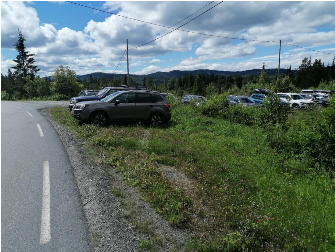
Parkering sti Vehus

1 - Turen til Vehuskjerringa frå Vehus har problem med parkering, der vert det parkert på motsett side av vegen og dei som skal på tur må presse bilen inn i krysset til Versto. Samstundes er det ein skummel plass å krysse vegen på midt i ein sving.