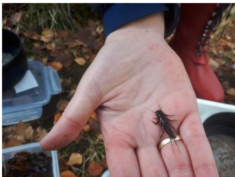
Figur 3. I Tansåi var det rikeleg med Dinocras cephalotes , som er den største steinflugearten i Skandinavia