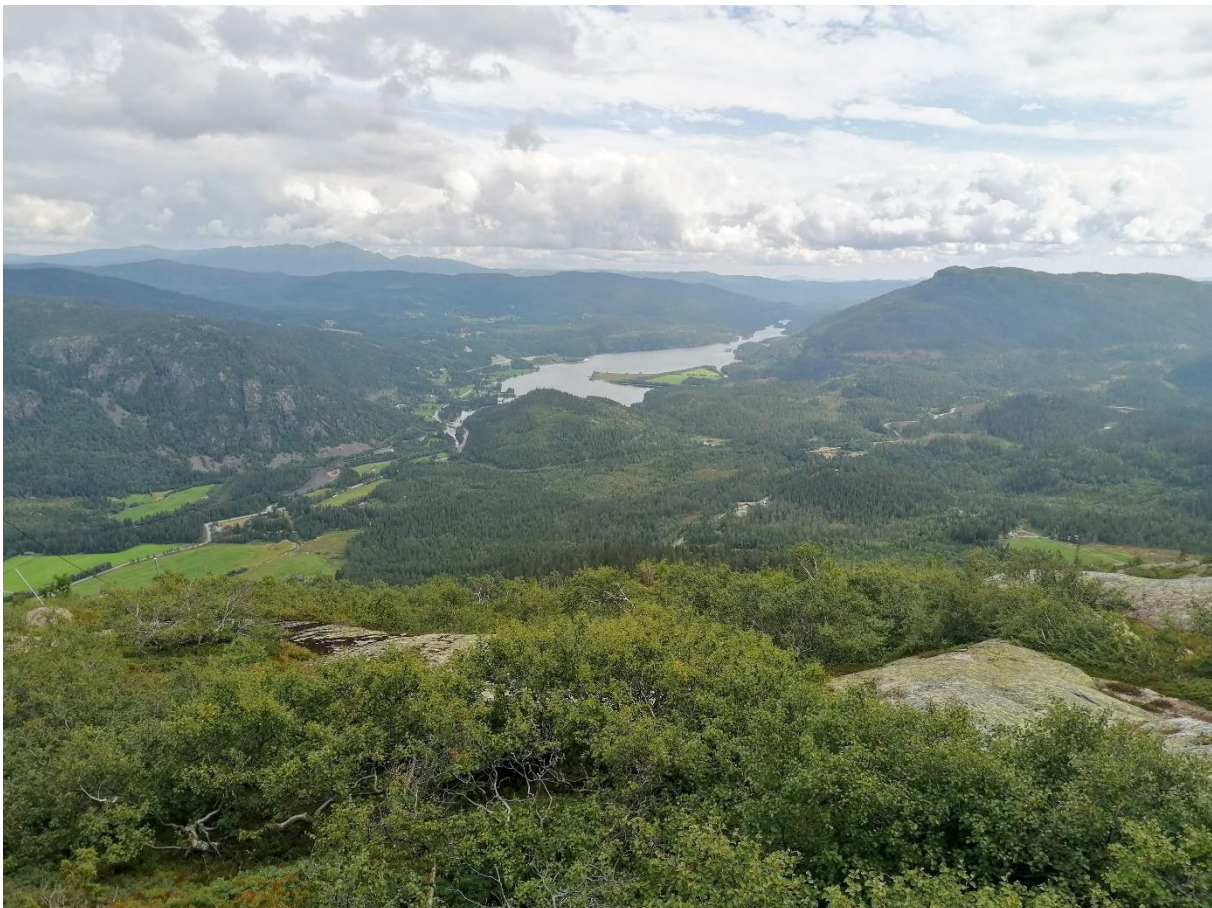
Vinjevatn sett frå Stekkjen