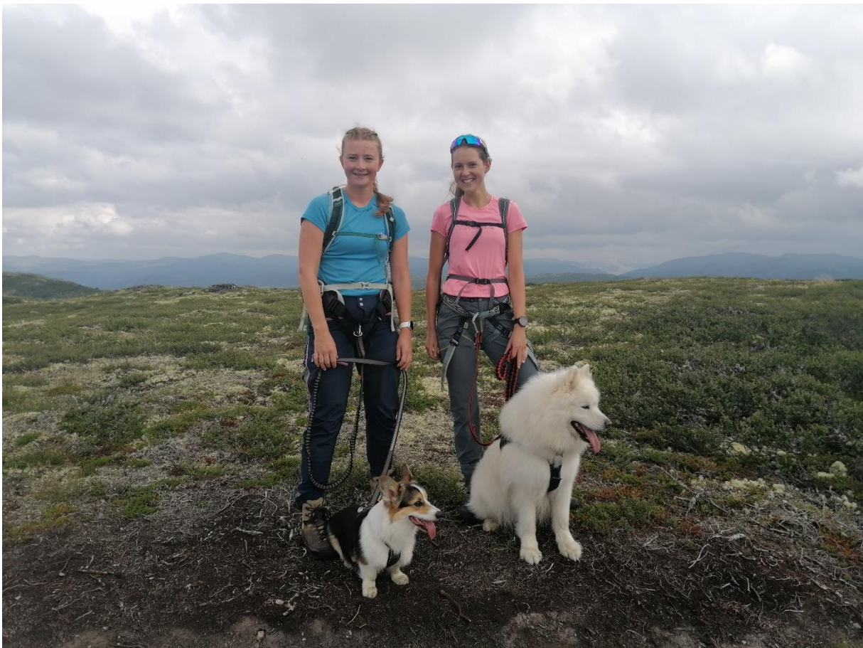
Mange er flinke til halde hunden i band. Her to jenter møtt på tilsynstur på ved Bossnuten.